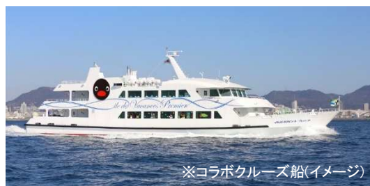
※コラボクルーズ船(イメージ)